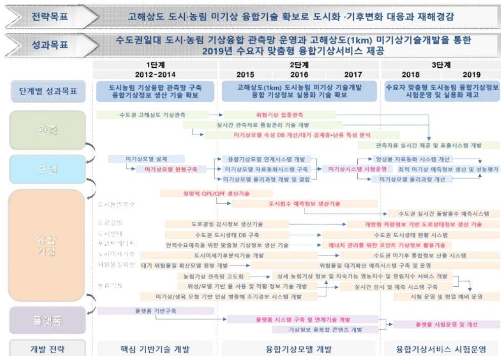
Fig. 1. WISE ‘차세대 도시·농림 융합 스마트 기상서비스 개발’ 연차별 로드맵.

Weather Information Service Engine (WISE) '차세대 도시·농림 융합 스마트 기상서비스 개발' 사업의 최종목표는 기상기후정보를 현실에 맞게 가공하고 수요자에 맞게 응용하고 융합해서, 국민들에게 현실적·실체적으로 보다 유용한 정보서비스를 제공하는 것이다. WISE 플랫폼 시스템은 재해경감을 위한 의사결정 지원 기능을 극대화하고, 국민과 국가를 위한 차세대 기상서비스를 창출하는데 기여한다(Fig. 1 참조).